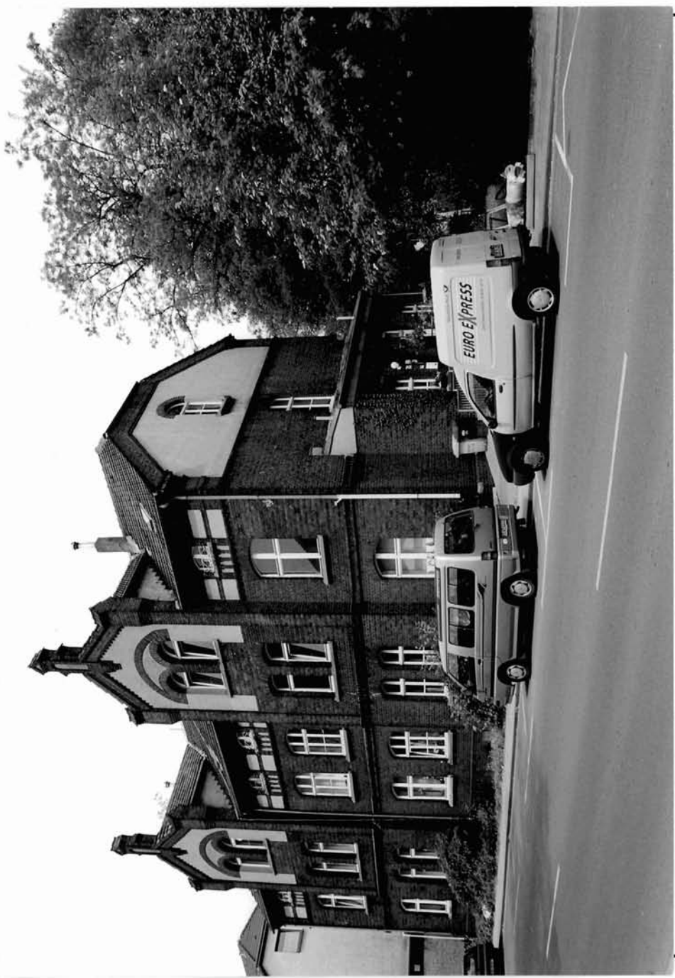
Ückendorfer Straße 73/73 a