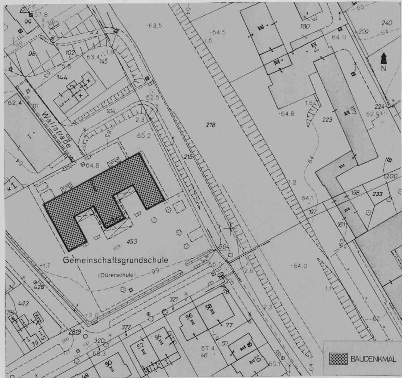
Lageplan u. a. Darstellungen Maßstab 1:1000

Hinweise auf Inventare, Literatur, Archivquellen, Zeichnungen, Fotos, Karten u. a.