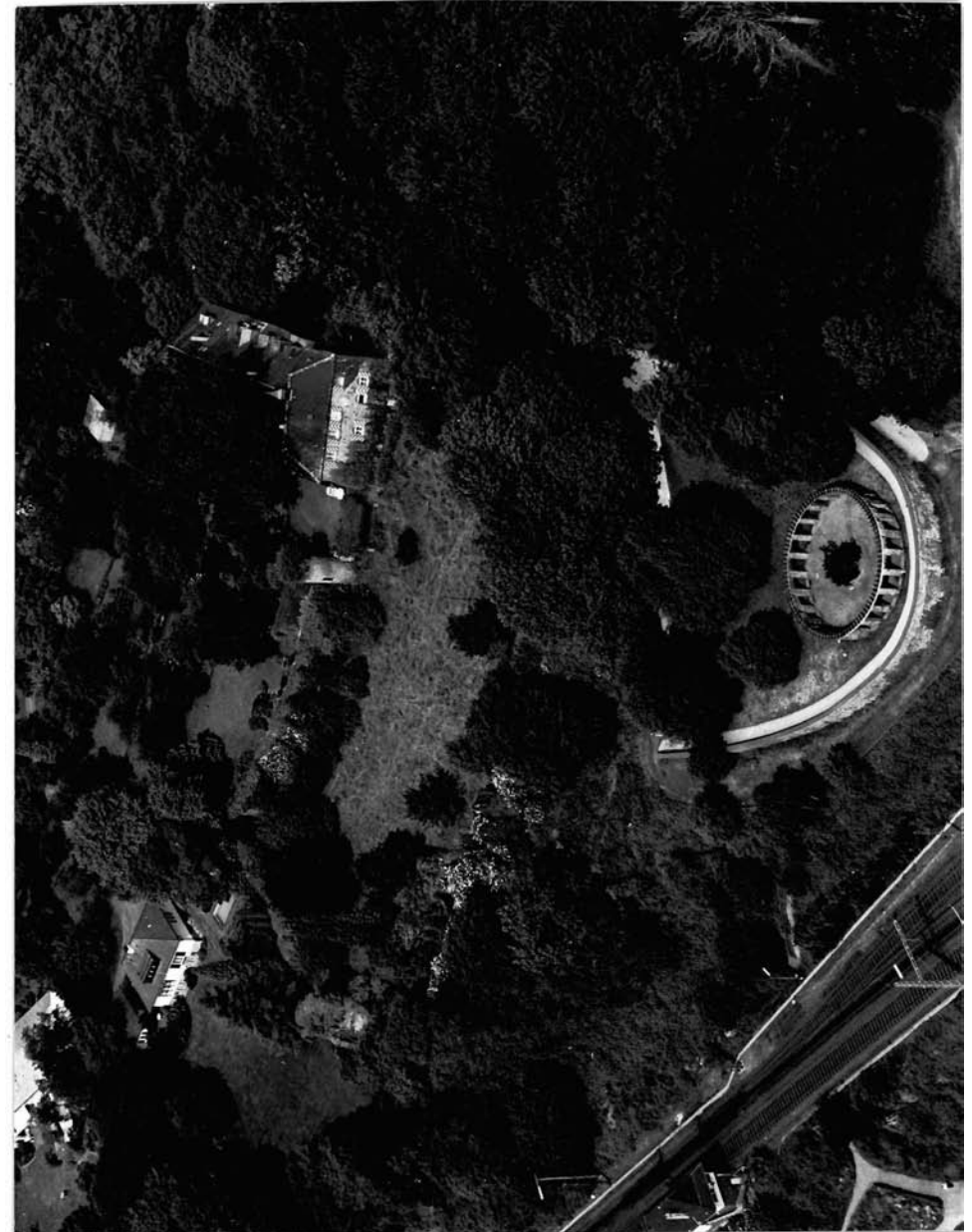
Freigabe Nr.: 43 J 515