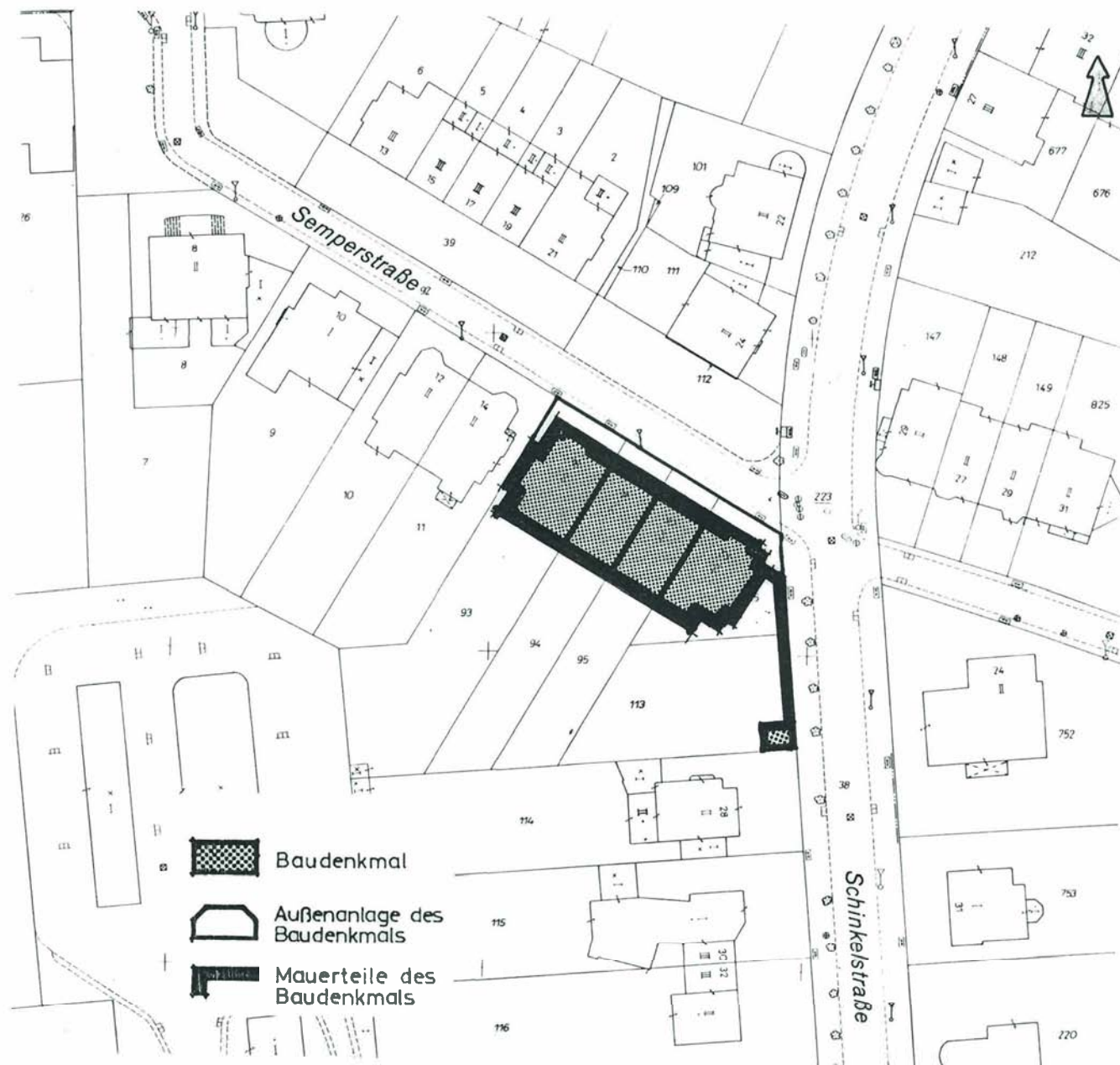
Lageplan (M 1:1.000)