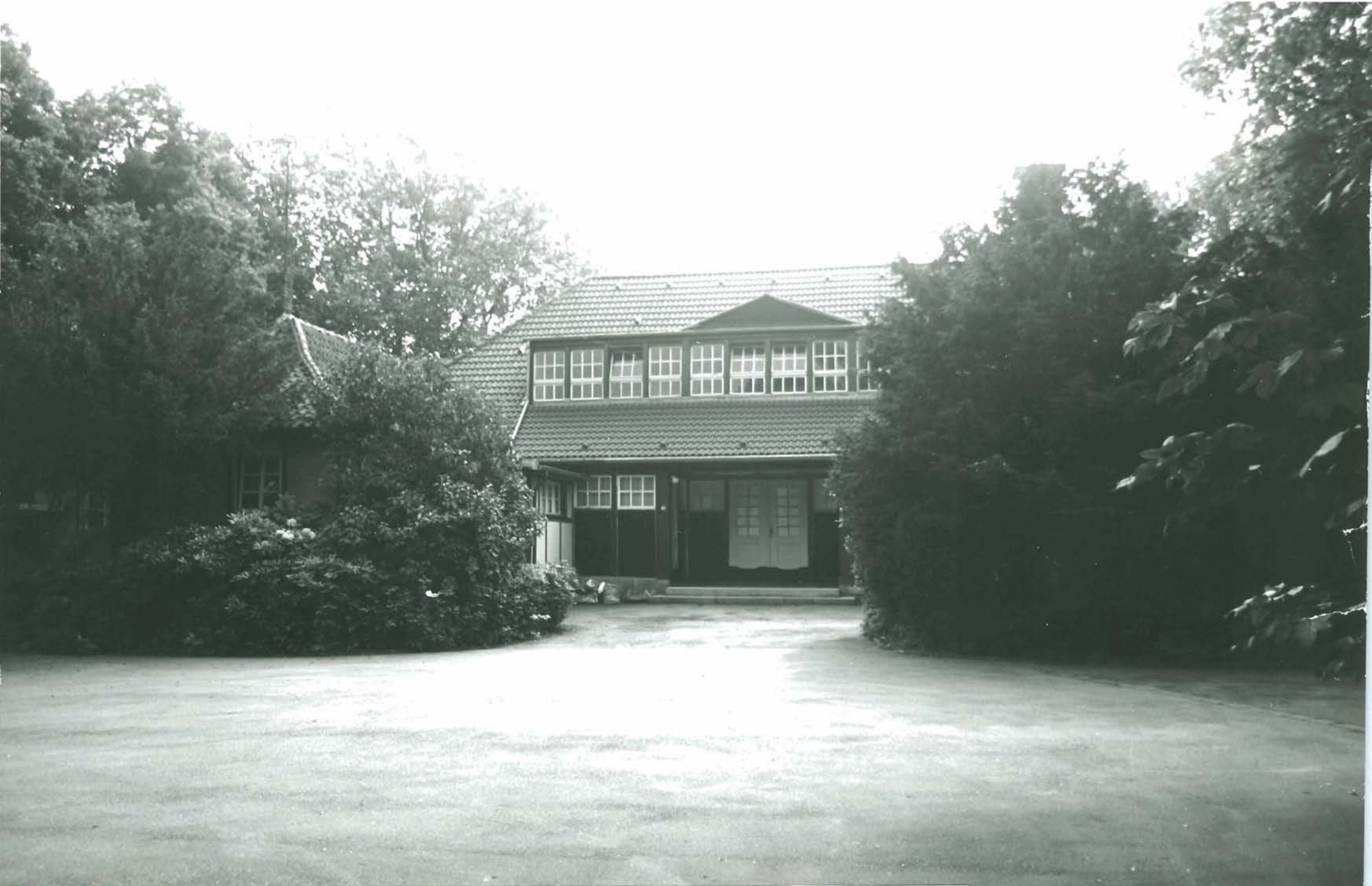
JUGEDDHALLE SCHONNEBECK SAATBRUCHSTRASSE